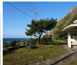
●大久保浜キャンプ場