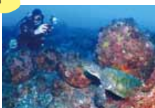
大島ダイビング連絡協議会 www.oshima-diving.org